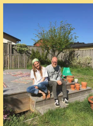
Red Top och Matilda — Saltet

Om några veckor är det semestertider, glad sommar önskar vi!