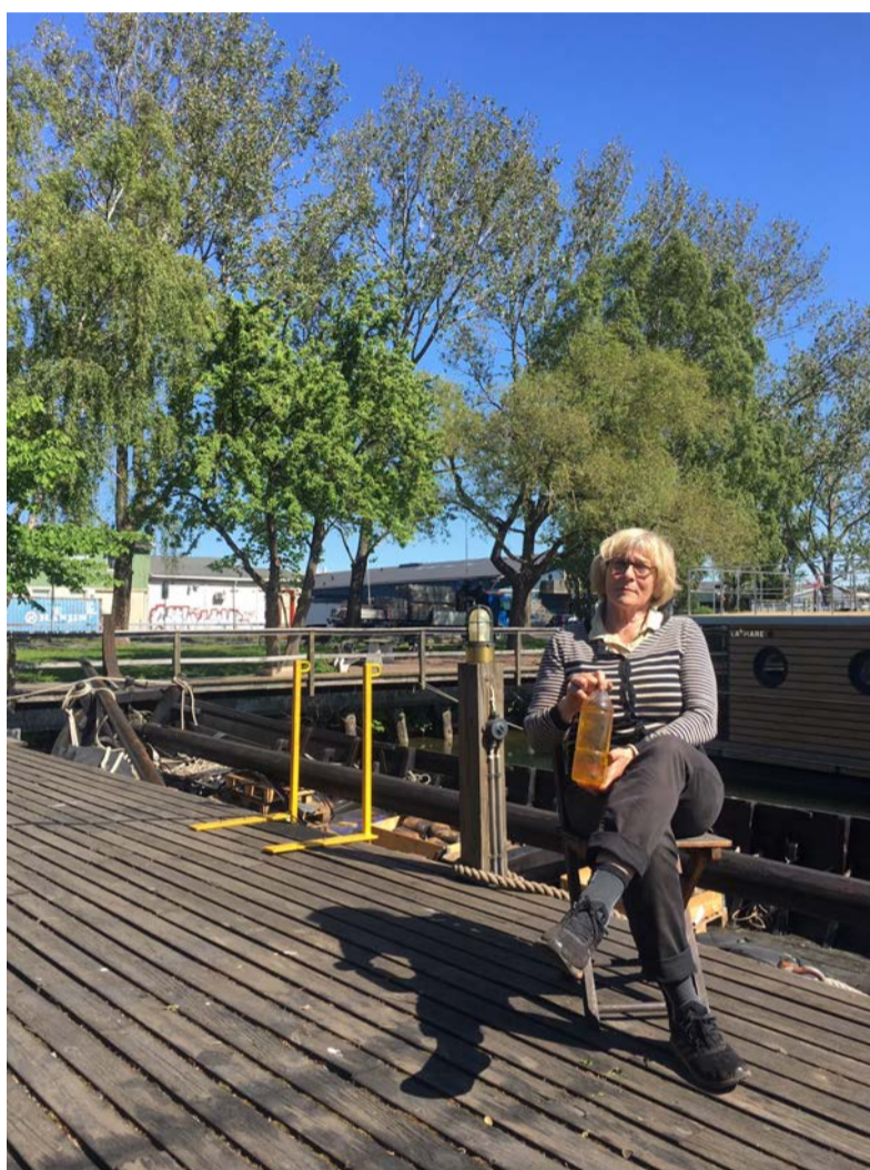
Siv med brunsåpa i handen på altanen utanför butiken på Järnmalmsgatan.