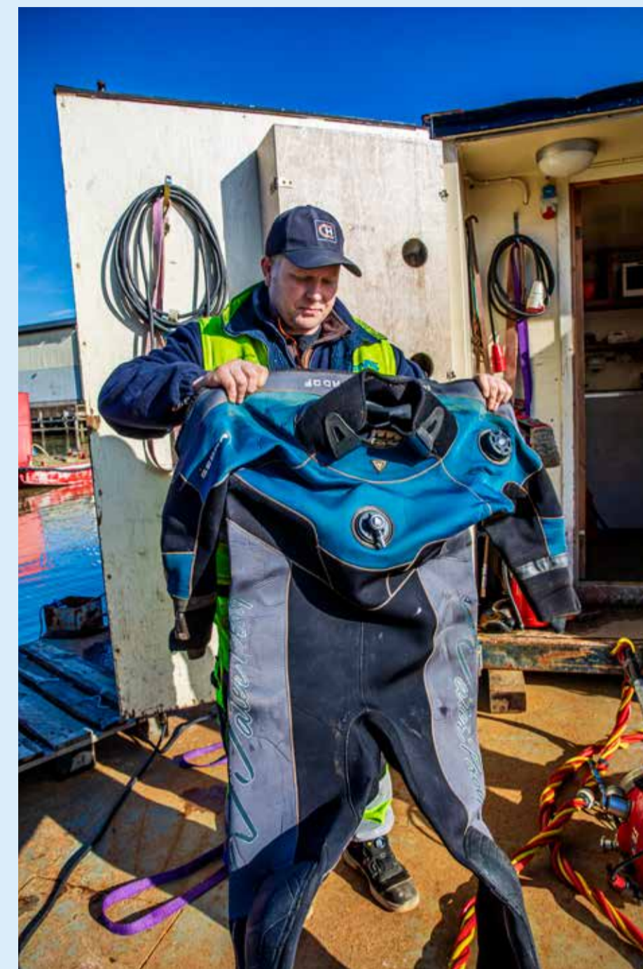
På Frog Marine Service jobbar man alltid i lag om tre: en dykare, en reservdykare och en dykledare. Men i vattnet är dykaren alltid själv.