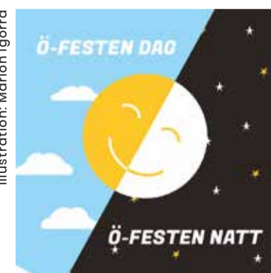
Illustration: Marion Igorra

Är ni intresserade av att höra mer eller kanske bli en partner eller kanske både och, hör av er till Saltet på info@saltet.org . Om vi har tur blir båten alltså en buss innan den blir en båt igen.