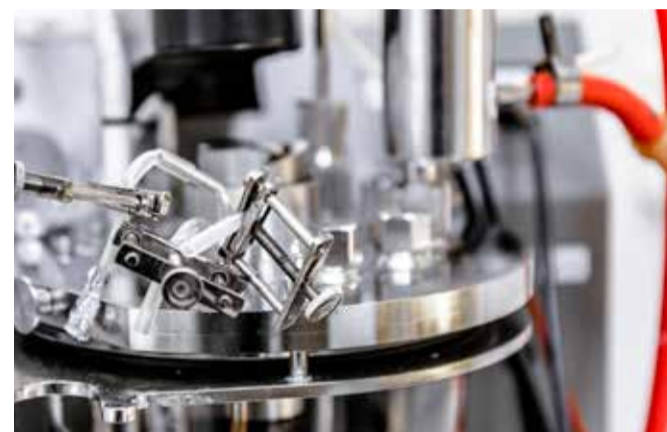
Proteinet som Mycorena fermenterar på Kalkbruksgatan har en neutral smak och lukt. Vilket är fördelaktigt om det ska kunna användas som en ingrediens i allt från biffr till proteinshakes.

Medan produktion av kött- och växtprotein kräver enorma mängder mark och vatten kan svampprotein Promyc odlas i reaktorer.